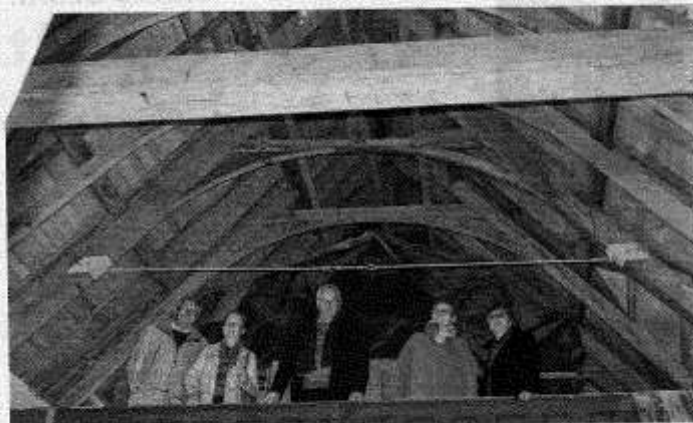
La charpente, une œuvre d'art.

Le maire l'avait dit lors de l'assemblée générale, les charpentiers ont réalisé un travail impressionnant, une charpente entièrement en chêne et refaite dans sa quasi-totalité. Bon boulot également des maçons et des couvreurs. Il reste encore un mois de travail pour que l'église soit hors d'eau, suite à quoi la pose du lambris pourra être réalisée. Ce sont des équipes de deux ouvriers qui interviennent, d'où la lenteur du chantier, mais l'attente vaut le coup.