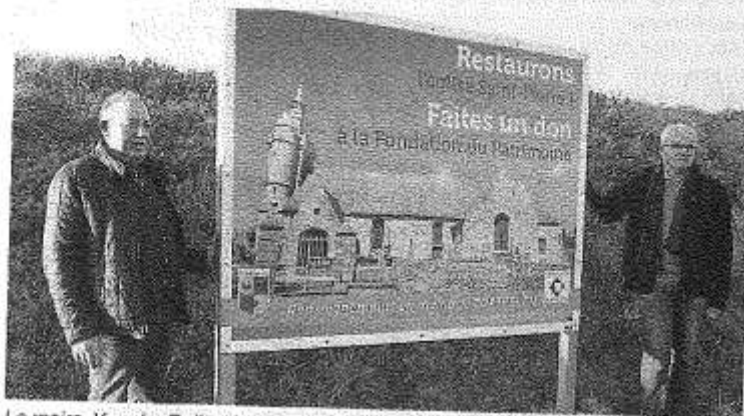
Le maire, Yves Le Rolland, avec le président des Amis de l'église.