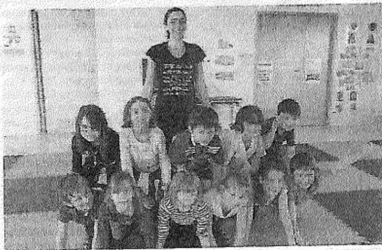
Les acrobaties des Poissons volants ont beaucoup plu.

Comme à chaque vacances scolaires, le Comité local d'animation du Rudonou (CLA) met en place des ateliers récréatifs pour le plus grand bonheur des enfants. La semaine dernière, ils ont été une vingtaine, répartis en deux groupes, selon les tranches d'âge, à participer à celui de Mélanie Le Marchand, des Poissons volants, de Camlez. Il s'agissait d'une activité de portés acrobatiques. Dominique Le Normand, la