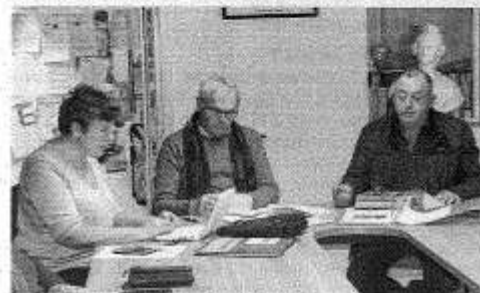
Le bureau s'attache à trouver des financements.